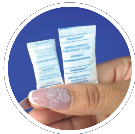
Foto con presentación de 0.5 y 1 g